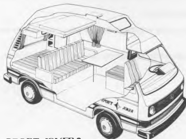
SPORT JOKER 3

Der Fahrzeug- und Einrichtungsboden ist bereits für den eventuellen Ausbau mit weiteren Ausstattungsteilen wie der Küche, Gastank oder Eberspächer Heizung vorbereitet.