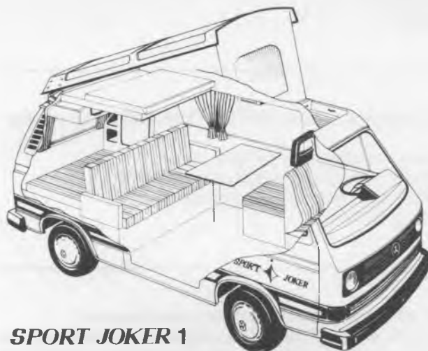
SPORT JOKER 1

Generell erfolgt die Zulassung als PKW-Kombi mit 5 Sitzplätzen, bei Wahl einer Doppelsitzbank mit 6 Sitzplätzen. Zusätzlich besteht die Möglichkeit des Einbaues einer zwei- oder dreisitzigen Mittelsitzbank, d.h. der SPORT JOKER kann maximal 9 Personen befördern.